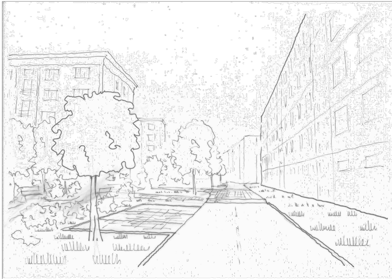
ÚPRAVA KOMUNIKACE – ZKLIDNĚNÍ, ZPOMALOVACÍ PRAHY, PARKOVACÍ STÁNÍ, NÁVRH ZELENĚ A KLIDOVÉ ZÓNY