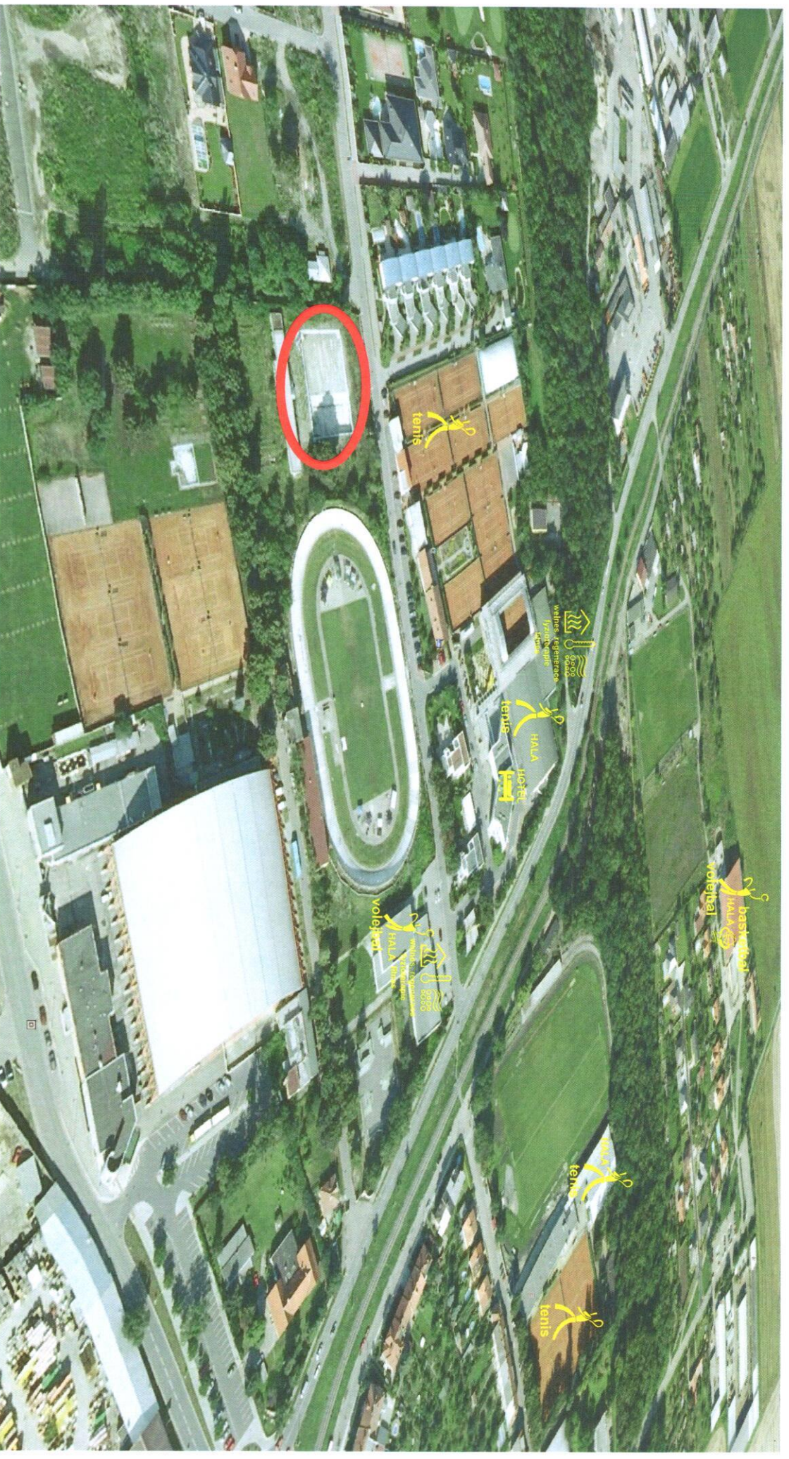
vizualizace areálu - současný stav