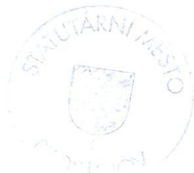
Jiří Rozbořil hejtman Olomoucký kraj