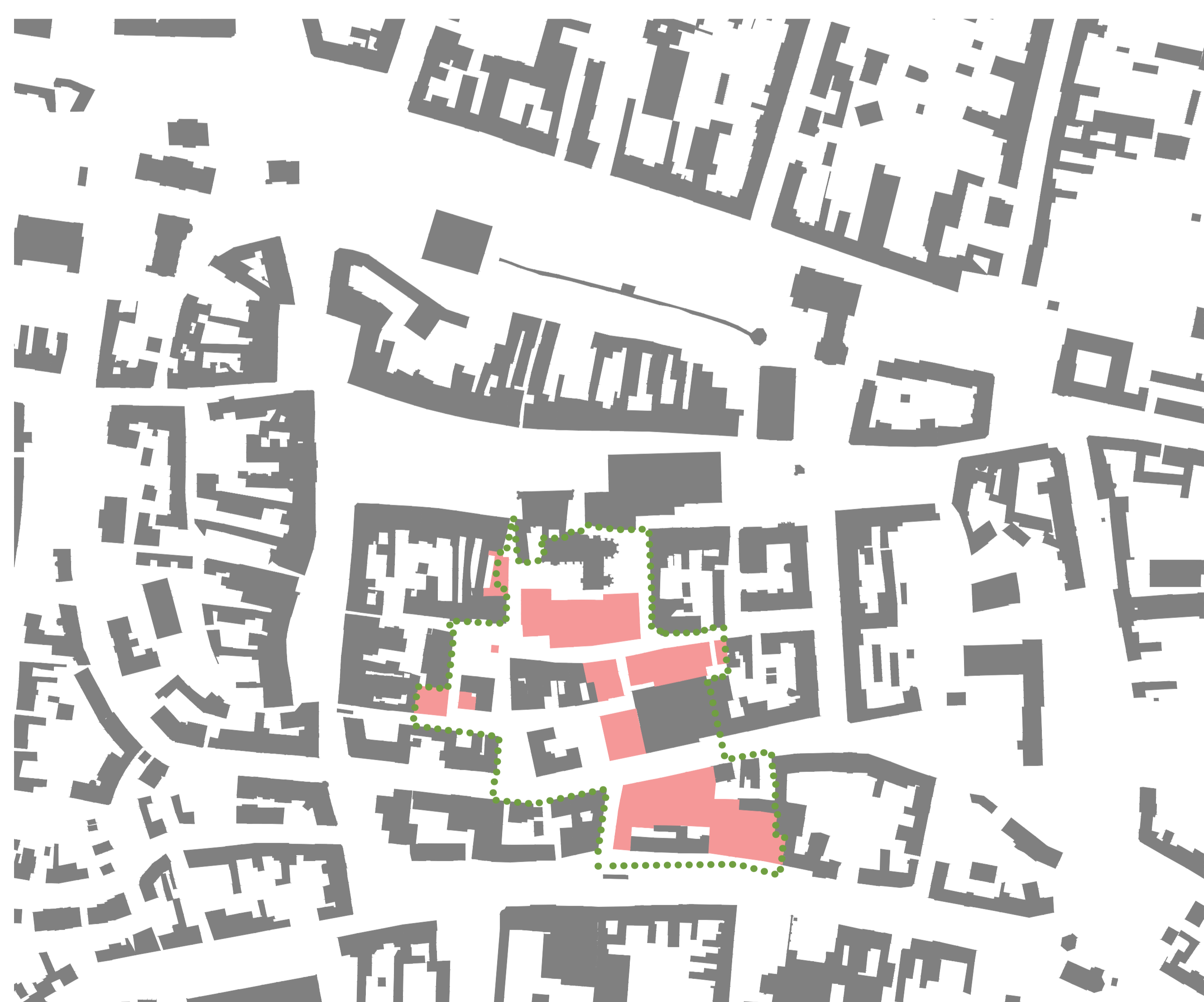
SITUACE ŠIRŠÍCH VZTAHŮ M1:2500

ŘEŠENÉ ÚZEMÍ (3,86 ha) A VEŘEJNÉ PROSTRANSTVÍ STÁVAJÍCÍ STAVEBNÍ POZEMKY A STÁVAJÍCÍ STAVBY V ŘEŠENÉM ÚZEMÍ NOVÉ / UPRAVENÉ STAVEBNÍ POZEMKY A NOVÉ STAVBY V ŘEŠENÉM ÚZEMÍ PERSPEKTIVNÍ ZOBRAZENÍ REZ VEŘEJNÝM PROSTRANSTVÍM 1 ZASTŘEŠENÁ MĚSTSKÁ TRŽNICE / VÍCEÚČELOVÝ VEŘEJNÝ PŘEDPROSTOR KASC (ZÁEMÍ TRŽNICE V KASC) 2 PARKOVACÍ DŮM (1 PP + 3 NP)