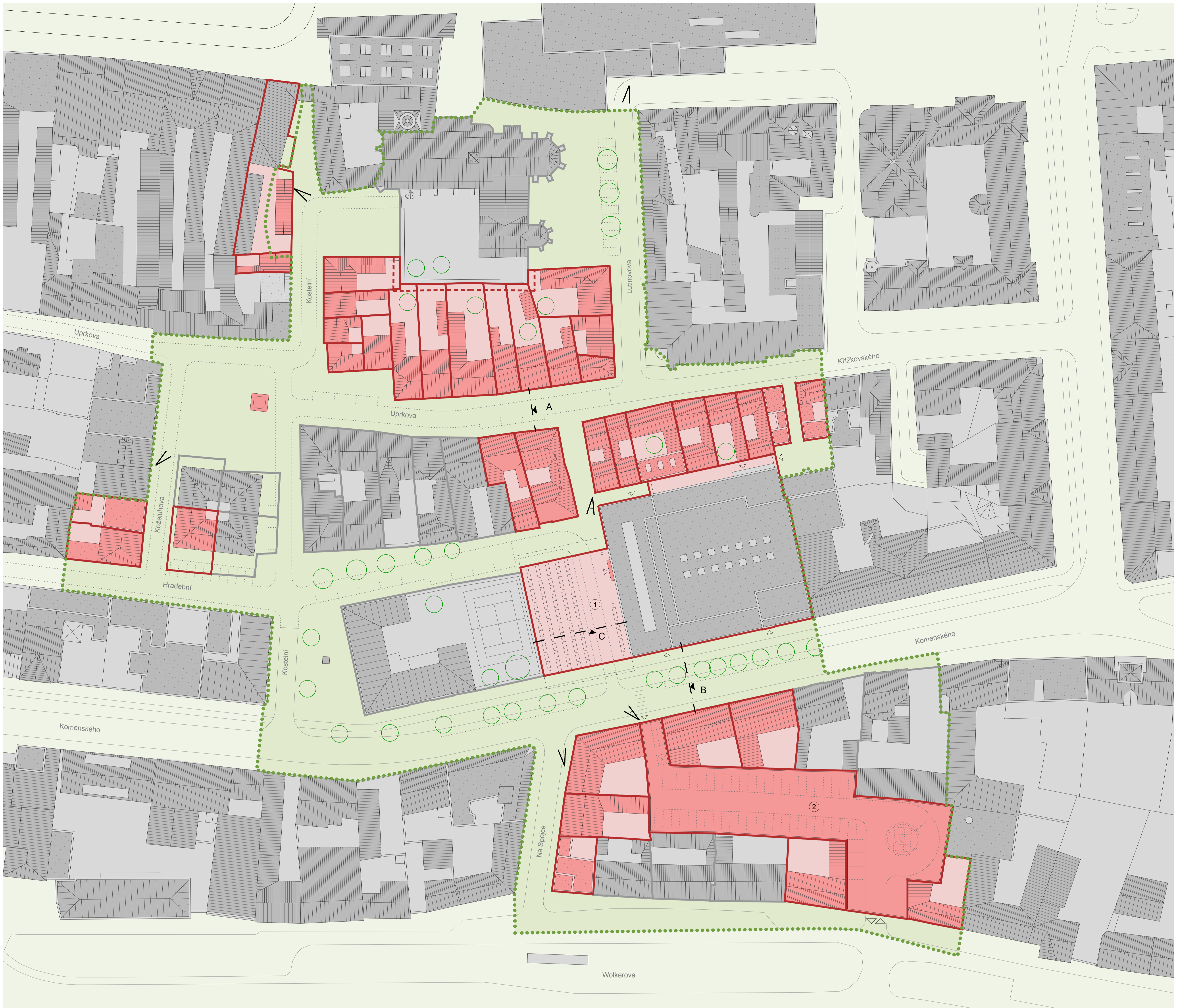
SITUACE URBANISTICKÉHO ŘEŠENÍ M1:500

ŘEŠENÉ ÚZEMÍ (3,86 ha) A VEŘEJNÉ PROSTRANSTVÍ STÁVAJÍCÍ STAVEBNÍ POZEMKY A STÁVAJÍCÍ STAVBY V ŘEŠENÉM ÚZEMÍ NOVÉ / UPRAVENÉ STAVEBNÍ POZEMKY A NOVÉ STAVBY V ŘEŠENÉM ÚZEMÍ PERSPEKTIVNÍ ZOBRAZENÍ REZ VEŘEJNÝM PROSTRANSTVÍM 1 ZASTŘEŠENÁ MĚSTSKÁ TRŽNICE / VÍCEÚČELOVÝ VEŘEJNÝ PŘEDPROSTOR KASC (ZÁEMÍ TRŽNICE V KASC) 2 PARKOVACÍ DŮM (1 PP + 3 NP)