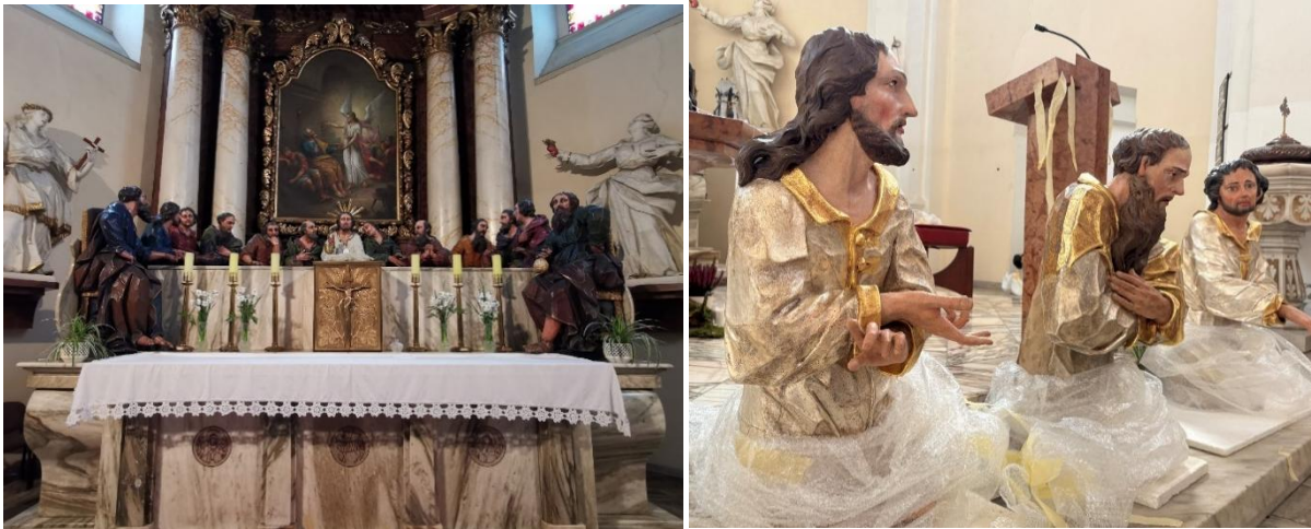
Kostel sv. Petra a Pavla, Petřské nám., Prostějov. Navrhovaná akce: restaurování Poslední večeře (3. etapa)