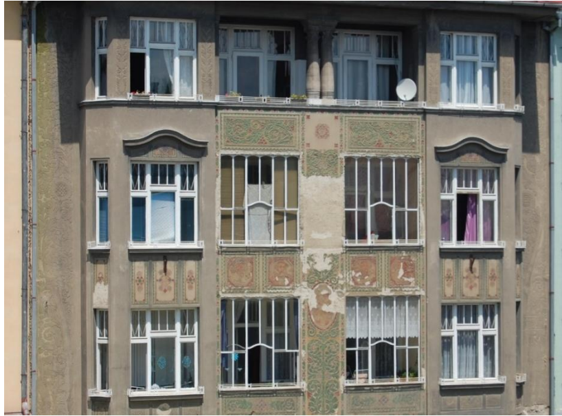
Měšťanský dům – Vrlův dům, nám. E. Husserla 160/8. Navrhovaná akce: restaurování fasády objektu.