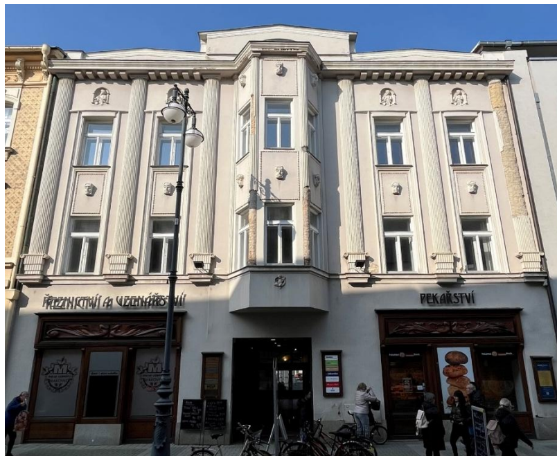
Objekt, Dukelská brána č. 4 Navrhovaná akce: obnova fasády objektu